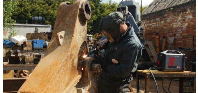
Wartung und Reparatur